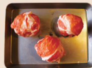
生肉をスキマなくぐるぐる巻きにします