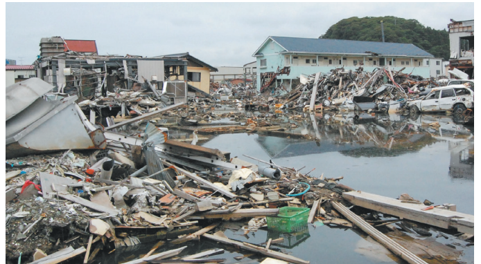
東日本大地震で、建物、道路などが壊滅的に破壊された気仙沼市街

東日本大地震では、大津波が発生し、見慣れたまちは一瞬にして飲み込まれました。こうした災害により道路が寸断すると、物資はもちろん、他の地域からのLPガスの緊急搬送は困難が予想されます。地域住民の避難場所となる公共施設等でLPガス機器を常用することにより、災害時のライフラインを確保することができます。