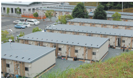
仮設住宅での暮らしを支えるLPガス