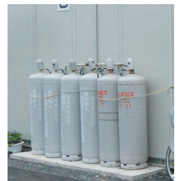
生活に必要なコンビニなど仮設店舗へも供給