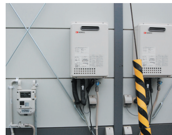
ガスコンロに加え、給湯器も設置され、ライフラインが確保された